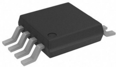
Bild kann Darstellung sein. Siehe Spezifikationen für Produktdetails.