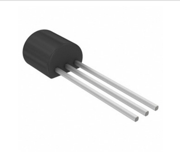
Bild kann Darstellung sein. Siehe Spezifikationen für Produktdetails.